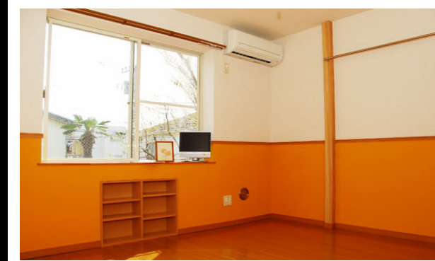
大きな窓で光溢れる部屋!! 窓から見えるヤシの木が可愛いです

ガスコンロ1口 フローリング 角部屋 インターネット無料 脱衣所 バス・トイレ別